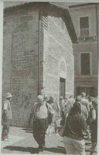
Turisti stranieri a Chieti A destra turisti a Castel del Monte durante la giornata del Ferragosto

Il programma aiuta persone che vogliono acquistare proprietà all'estero a trovare la casa dei sogni. Potenziali acquirenti partono dalla Gran Bretagna per recarsi nella zona d'Europa cui è dedicata la puntata. Giunti sul posto, esaminano alcune proposte immobiliari e visitano il territorio. Spesso la trasmissione si conclude con l'acquisto dell'abitazione. La casa di produzione Freeform Productions è già sbarcata in regione. L'Abruzzo Film Commission collabora all'individuazione delle locations. Le riprese, iniziate il primo settembre, andranno avanti per una settimana toccando Montefino e Bisenti nel teramano, poi Elice, Spoltore, Moscufo e Pescara, infi-